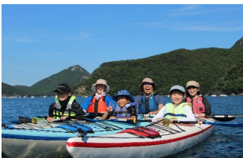
シーカヤック体験