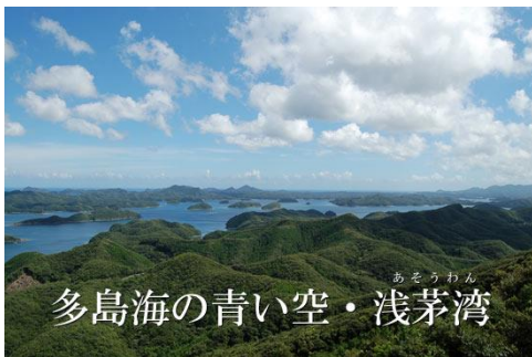
多島海の青い空・浅茅湾