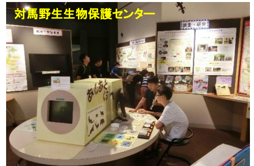
対馬野生生物保護センター